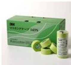
マスキングテープ 3M143N 243Jに比べ薄いです 12mm 100巻 15mm 80巻 18mm 70巻 20mm 60巻 24mm 50巻 30mm 40巻 40mm 30巻 50mm 20巻 すべて18m