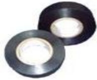
ナシジテープ ヤザキ 19mmx20m BR-019(黒) BR-077(赤) 25mmx20m NW-120(黒)