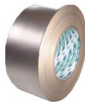
アルミテープ 944SC-50 SD-2 50mmx10m 50m