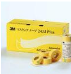
マスキングテープ 243J plus 143Nに比べ厚いです 6mm 200巻 9mm 100巻 10mm 100巻 12mm 100巻 15mm 80巻 18mm 70巻 20mm 100巻 24mm 50巻 30mm 40巻 36mm 30巻 40mm 30巻 50mm 20巻 60mm 20巻 すべて18m