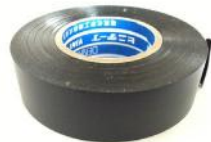
ビニテープ デンカ 19mmx20m 50mmx20m