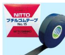
944NG-1 ブチルゴムで防水処理に 最適です。しかもテープ どうしにしか着かないので 粘着しません 19mm幅10m巻