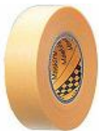
マスキングテープ (3M) 15mm 30mm 50mm x18m x18m x18m BR-083 BR-084 BR-092 8巻 4巻 2巻