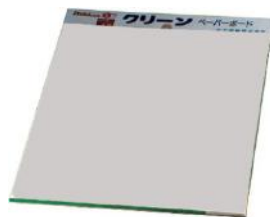
クリーンペーパーボード

パテ練り用紙製パテ定盤 使用後一枚ずつ剥がすので 毎回清潔です 230x280mm 30枚